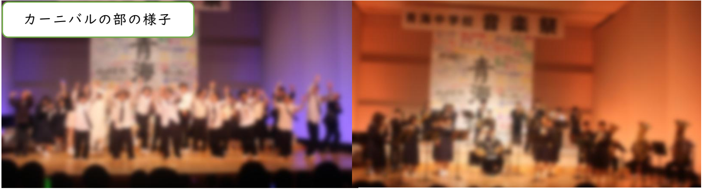
カーニバルの部の様子