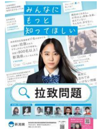
啓発ポスター(新潟県作成)

今回の学びを通して、生徒は「知ること」「関心を持ち続けること」の大切さを改めて実感しました。