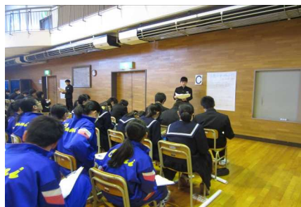
糸魚川市活性化計画発表会（3年）