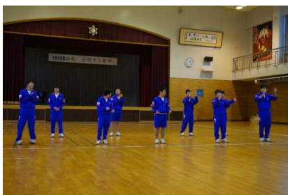
昼休み有志による ダンス発表会 <3年グループ>