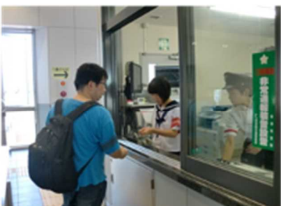
ときめき鉄道糸魚川駅