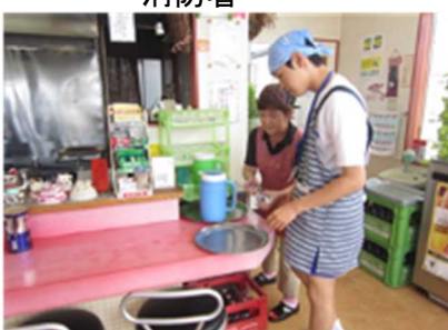
おっちゃんラーメン