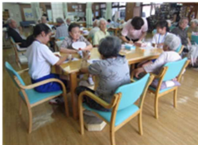
ディサービスセンターおうみ