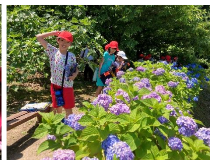
大王あじさい園から臨む「弁天岩」の絶景（3年生校外学習にて）