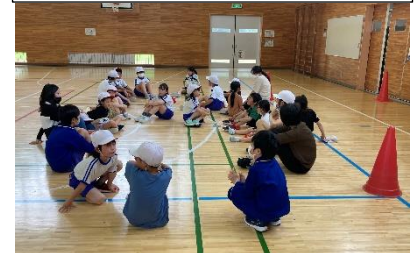
活動の後は、みんなで振り返り