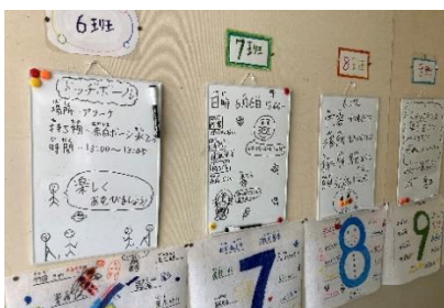
各班の活動計画は掲示板に

6月6日(火)は、子どもたちが楽しみにしていた、今年初めての「わかっし班遊び」の日でした。全校児童を16班に分けた縦割り班の仲間で、一緒に休み時間を過ごす活動です。各班で事前に相談して決めた遊びを思い切り楽しむ時間とあって、どの班も汗だくになりながら時間を惜しんで遊びました。