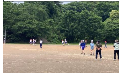
グラウンドでは「おにごっこ」