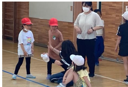
アリーナでは「けいどろ」遊び