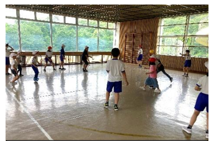
小体育館では「ドッジボール」