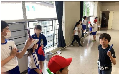
視聴覚室では「宝探し」に夢中