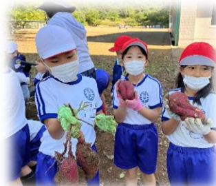
2年 10/21 さつまいもほり