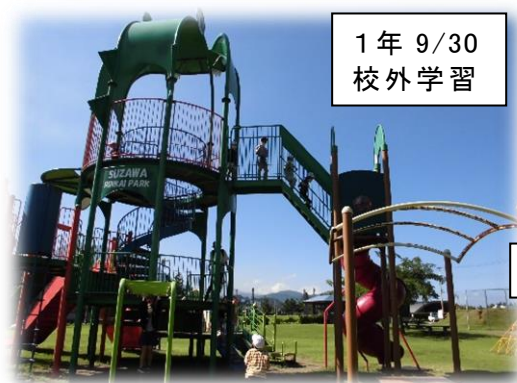
1年 9/30 校外学習