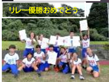
リレー優勝おめでとう

先日は、中学年企画の全校遊び「ひよこ相撲大会」がありました。足首をもって、ひよこの形になり、縦割り班対抗での対戦を行いました。高学年も少しだけ手加減をしながら楽しみ、みんなの笑顔いっぱいの姿にとっても幸せな気持ちになりました。9月のおててこ舞いや十二社の相撲大会では、私も神輿を担ぎ相撲を何番も取り「地域とともに生きる根知小学校のよさを体全体で感じました。また、こどもたちが真剣に舞う姿やこども相撲を楽しむ姿、周りで声援を送ったり用意していただいた豚汁を食べたり、金魚すくいをしたりして賑やかに過ごす姿、地域の伝統行事に参加する中にも多くの笑顔がありました。そして高学年の親善陸上大会。根知小学校チーム男女混合リレー第1位の結果も本当に立派でした。男子の中に入っても上位に入る好記録でした。表彰式では、誇らしげな表情でトロフィーを受け取り、たくさんの入賞者とともに記念撮影をする中にも笑顔が溢れました。この後もいくつかの発表場面が続きます。根知小児童の『青春』、できる精一杯の姿を認めながら成長を後押ししていきます。地域、保護者の皆様の「がんばってたね、がんばってるね」のお声掛けを今後ともどうぞよろしくお願いいたします。