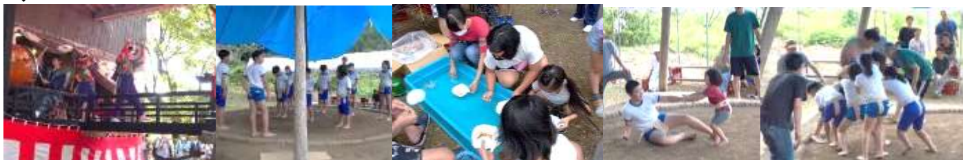
練習の成果を発揮