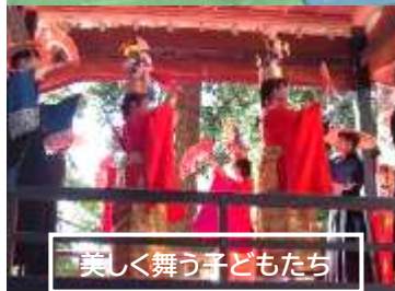
美しく舞う子どもたち