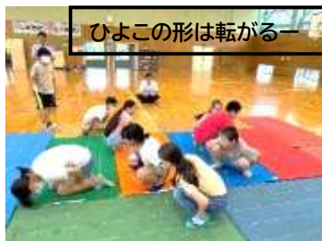
ひよこの形は転がるー