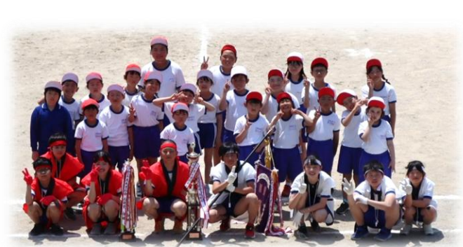
全員集合！記念撮影