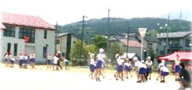
全校種目「ダンシング玉入れ」