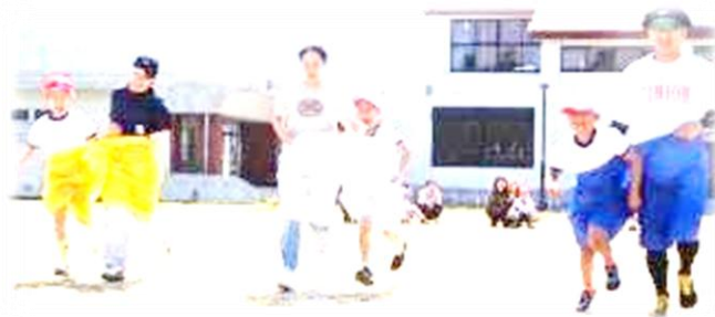
1, 2, 3年親子種目「親子でGO！」