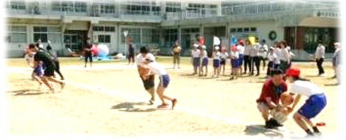
4, 5, 6年親子種目「親子のキズナ大レース」