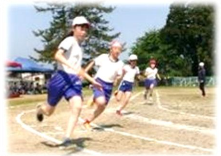
徒競走（左：低学年・中：中学年・右：高学年）