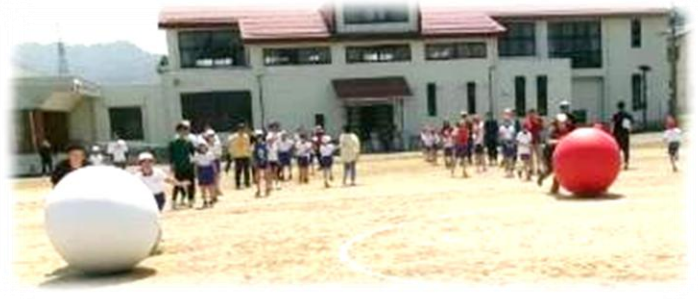
全校親子種目「大玉転がし」