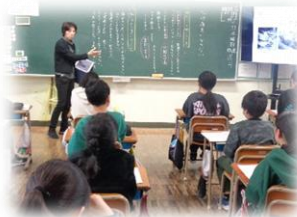
5, 6年(新潟水俣病被害者への差別)