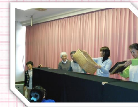
読み聞かせ講師陣による読み聞かせ