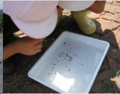
ヘビトンボを見つけたよ！