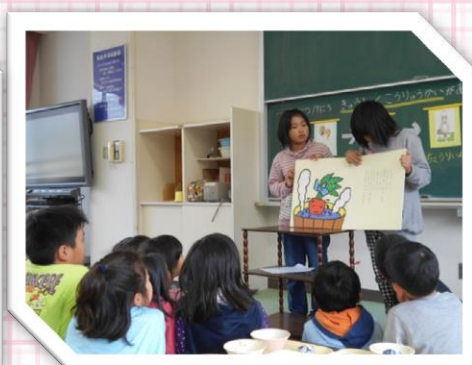
図書委員による読み聞かせ