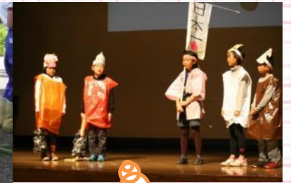
モリアオガエルって、準絶滅危惧種だよ！