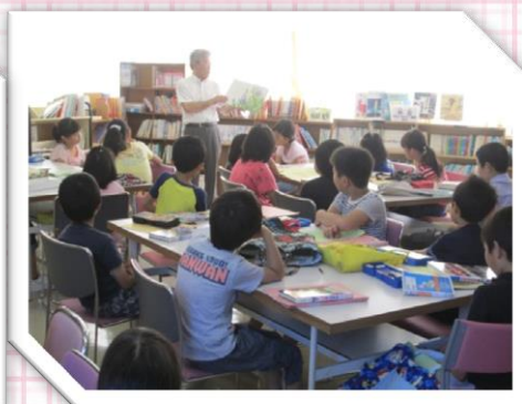
先生方による本の紹介