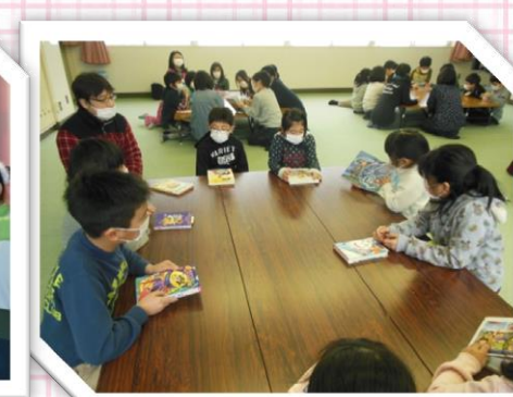
友達同士の読書交流