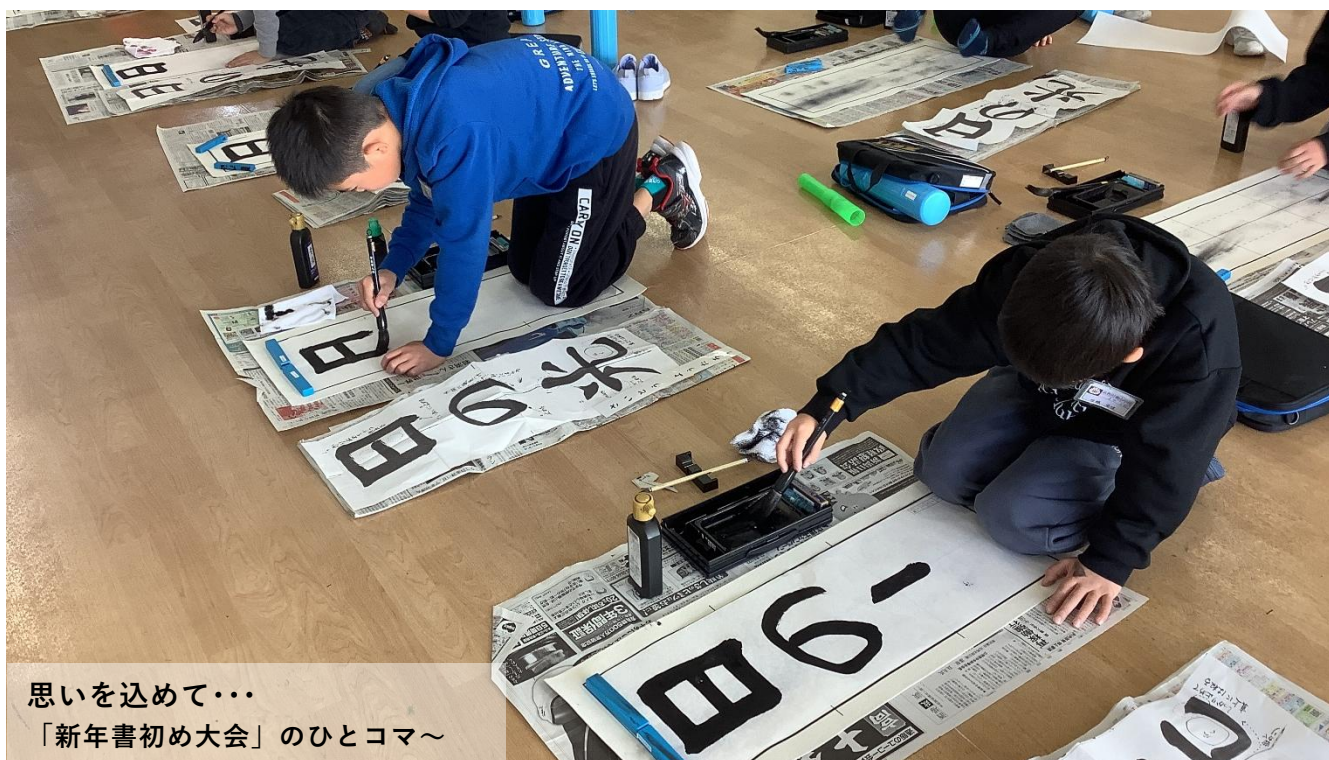
思いを込めて・・・ 「新年書初め大会」のひとコマ～