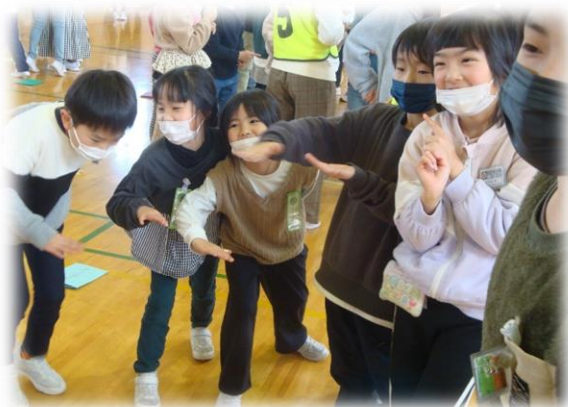
全校遊びで楽しむわかき班のメンバー↑