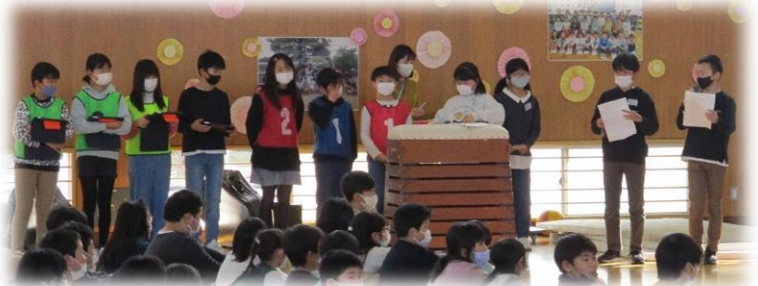
会の全体進行をする5年生↑