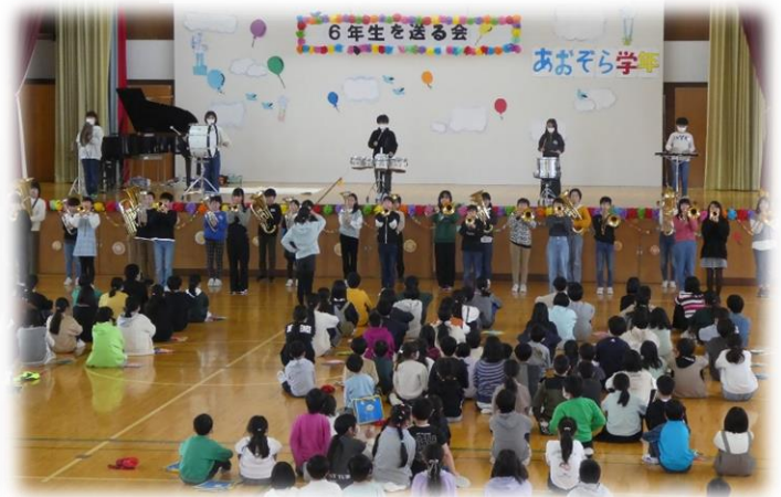
全校に初披露するにじいろバンド↑