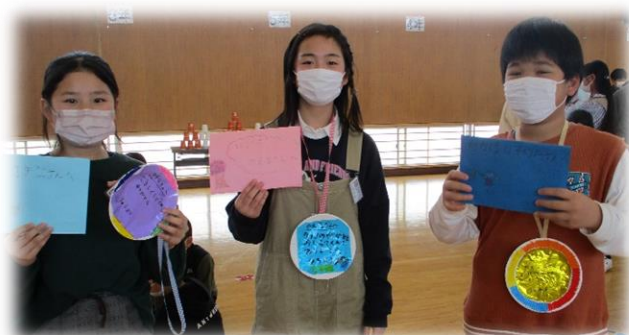
手作りプレゼントを受けとった6年生↑