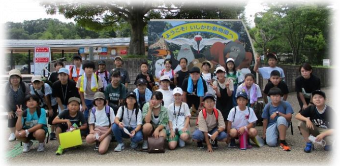
最上階からの絶景を見ながら夕食 ↓