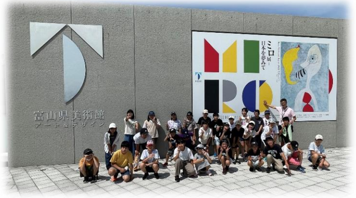
富山県美術館にて(1組) ↑

7月7日(木)～8日(金)に金沢・富山方面への修学旅行を実施することができました。子どもにとっては小学校時代最大の行事と言っても過言ではない修学旅行。ずっと心配していましたが、無事に全員で元気に楽しく行って来ることができました。ありがとうございました。同行した私が楽しかったので、子どもたちがいい子だったことは間違いありません。そして、何より2日間一緒にいたので、私自身6年生のことをよく知ることができました。