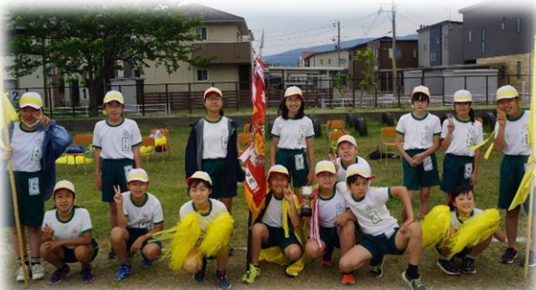
←優勝と応援賞をとったイエローを引っ張った6年生

最後に、保護者の皆さん、年度初めから行事を縮小・延期・中止等させていただきました。また、いろいろなお願いもしました。たくさん心配をおかけしましたが、ご理解とご協力をいただき、本当にありがとうございました。おかげさまで、本日「わかくさ運動会」ができます。ありがとうございました。これからもどうぞよろしくお願いいたします。