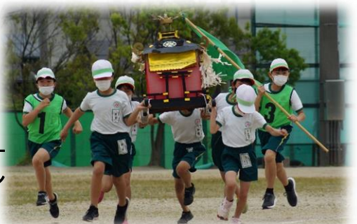
力強い走りやチームワークのグリーンのみこしリレー →