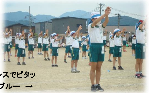
応援パフォーマンスでピタッと動きをそろえたブルー →