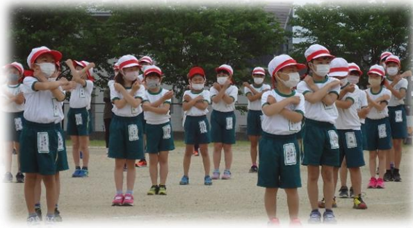
←ラジオ体操で次の動きの準備の動作がしっかりできるレッド