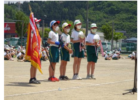
【閉会式；健闘をたたえ合い】