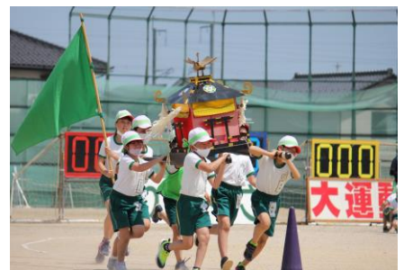
【みこしリレー；あふれる活気！】