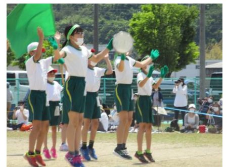
【応援パフォーマンス；グリーン】