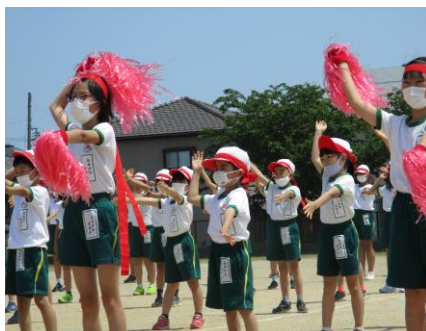
【応援パフォーマンス；レッド】