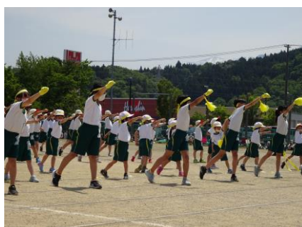
【応援パフォーマンス；イエロー】