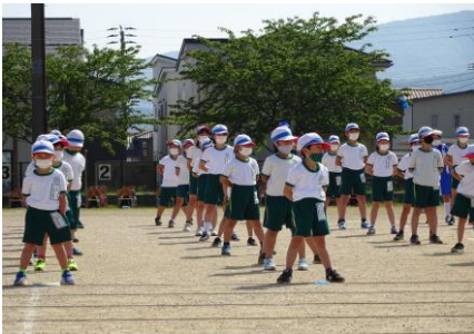
【開会式；整列がじょうず！】

様々な対応の中、児童は練習の成果と自分のよさを精一杯発揮していました。その一コマです。