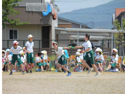
【リレー；見事なバトンパス!!】