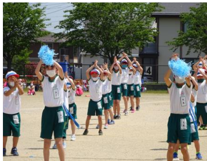
【応援パフォーマンス；ブルー】