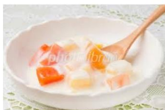
ヨーグルトサラダ