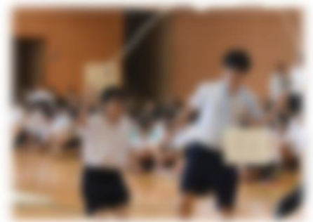
体育祭団決めアトラクションの一コマ

生徒会活動の随所でスローガンと系中三カ条を紹介し、全校生徒が同じ方向を向いて生徒会活動に取り組むことができるようにしていきます。