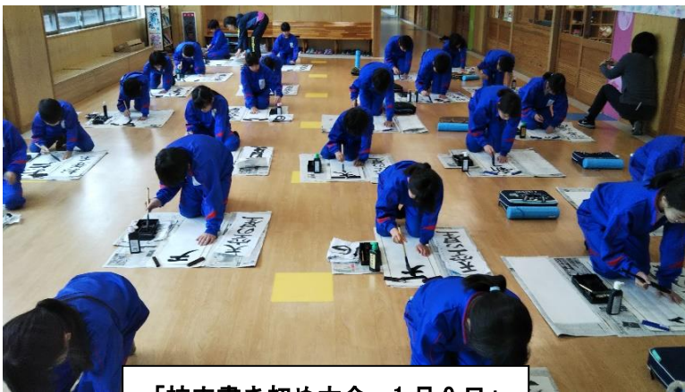
「校内書き初め大会 1月9日」

保護者、地域の皆様、明けましておめでとうございます。今年もよろしく申し上げます。昨年は令和の時代が幕を開け、学校も大きく地域との連携、協働をテーマに様々な活動を行ってきました。今年も大きな柱は変わりませんが、新たに未来へつなげていこうというスパイスを加えていきます。