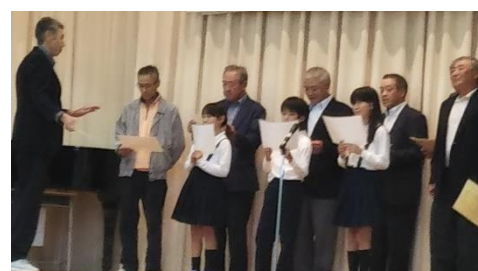
「大洞地区伝統保存会」