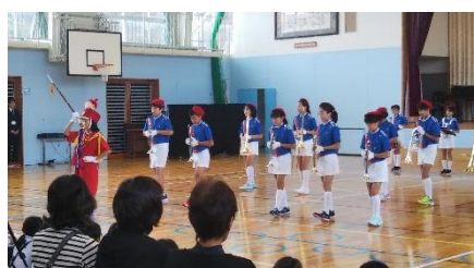
「金管グランドフィナーレ」