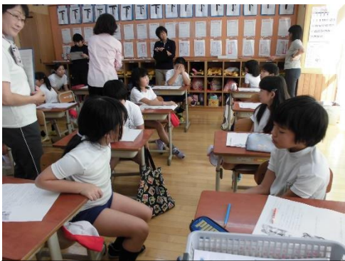
3、4年 道徳授業 話し合い

今週末には「創立50周年記念式典・文化祭」があります。たくさんの方から支援していただきながらきました。楽しみです。たくさんの方とつながったからこそ、米作りができ、おもてなし弁当ができ、歌も教えていただき、たくさんの方から祝ってもらえます。まさに、人とのつながりが生んだ創立50周年記念です。