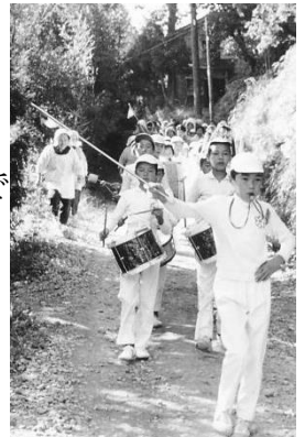
仙納校舎からの 統合大行進

鼓笛隊としての歴史はさらに遡り、統合後の新校舎(現在の校舎ではなく先代の校舎)の完成を祝い、それまで学んでいた大洞、百川、藤崎、筒石、徳合、仙納の各校舎から新校舎まで、「統合大行進」としてそれぞれ鼓笛パレードをしたことが記録され、写真も残っています。昭和 45(1970)年のことですから統合後だけでも 40 年以上の歴史があります。