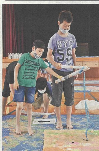
スタンプの道具などを協力して使い、グループ内で仲良く制作した