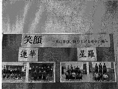
【団のチーム名とリーダー達です】