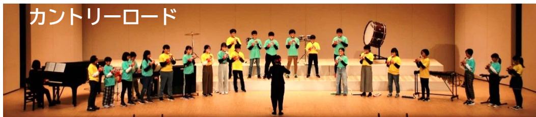
カントリーロード

11月1日(火)に、5・6年生が市小・中・特別支援学校音楽発表会に参加しました。演奏した曲は、合奏「ルージュの伝言」リコーダー合奏「カントリーロード」の2曲で、ともにスタジオジブリのアニメ映画の主題歌となっている曲です。学習発表会