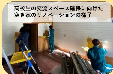
高校生の交流スペース確保に向けた 空き家のリノベーションの様子

ネットワーク校の生徒同士が、 対面やオンラインで、探究学習 の成果を合同で発表する機会を 設けています。