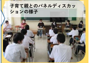
子育て親とのパネルディスカッ ションの様子

地域の魅力発 信や課題解決 に向けた実践 的活動を、地 域の方々と一 緒に行ってい ます。