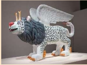
三沢厚彦《Animal 2020-03》2020年 樟、油彩 撮影/三沢厚彦 会場/あべのハルカス美術館 ©Atsuhiko Misawa, Courtesy of Nishimura Gallery