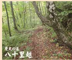
歴史の道 八十里越

魚沼市大白川字浅草山1501 TEL：025-798-4141 URL： http://www.eco-museum.jp/