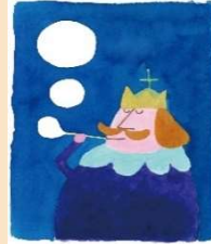
『ぼくは王さま』(文・寺村輝夫)表紙 1967 理論社 多摩美術大学アートアーカイブセンター蔵 ©Wada Makoto