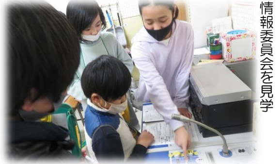
情報委員会を見学

ひとりごと 2月3日（木）に委員会見学がありました。4年生は、4月から正式に委員会活動が始まります。私は6名を引率する係を任せられました。移動時間を考えると1委員会5分で回らなければなりません。子どもたちは入退場の際に整列し番号をかけててきぱきと動いたり質問したりしていました。進級への意気込みが感じられました。