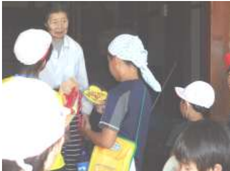
9月7日 安否札を配布している様子

上根知地域や小滝地域へは、高学年が総合的な学習の時間の学びの一環として、全家庭へ配布するように取り組んでいます。