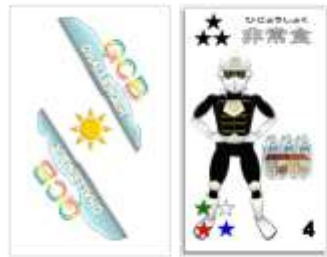
チャレンジャーカード