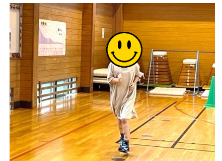
体育館4周で、マラソンカード1マスに色ぬりができます。先生方も一緒に走りました。