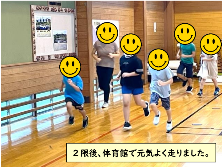
2限後、体育館で元気よく走りました。