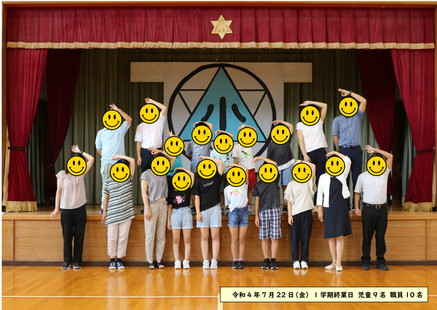
令和4年7月22日(金) | 学期終業日 児童9名 職員10名