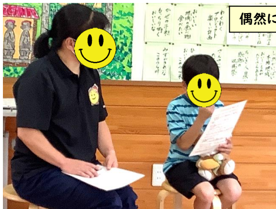
偶然に、来校者3名から参観いただきました。