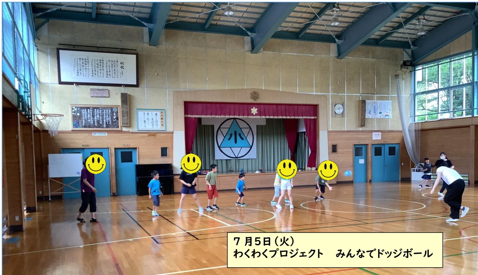
7月5日(火) わくわくプロジェクト みんなでドッジボール