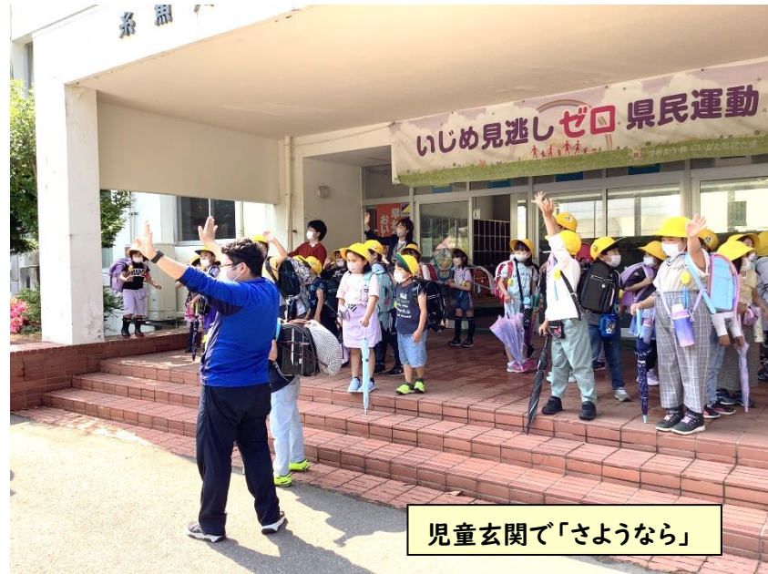
児童玄関で「さようなら」