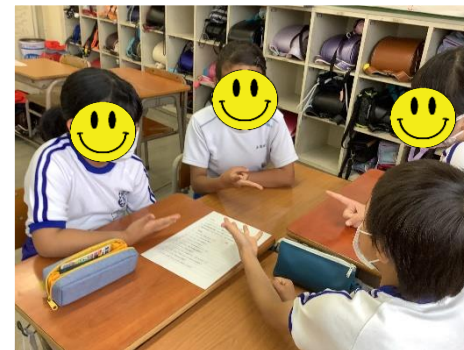
4年アイスブレイク