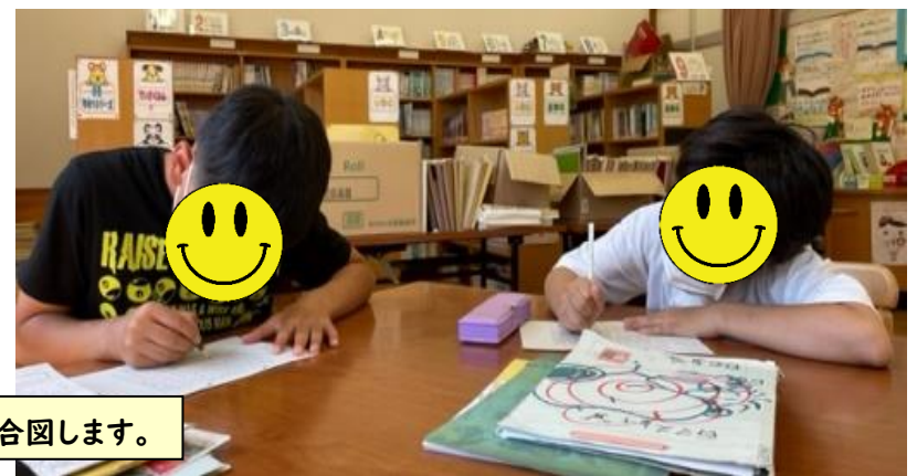
音読の後に、100マス計算をします。何分かったか、終わったら「はい!」と合図します。