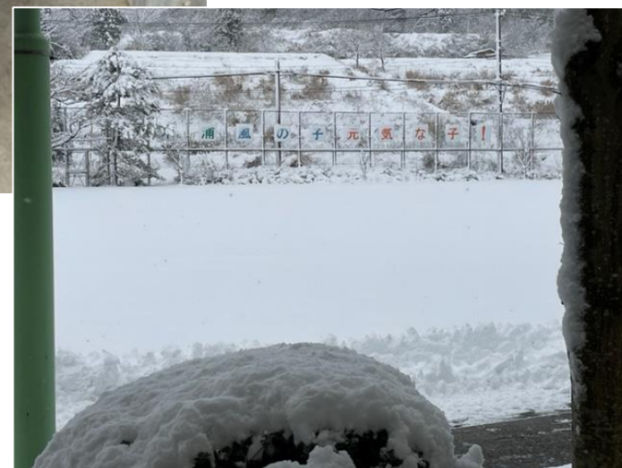
12月19日(月) 校長室から見える校庭の風景 県内大雪 →