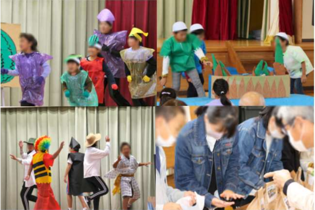
(左上) 1・2年「すいかひめ」 (左下) 5・6年「木浦ふしぎ発見」