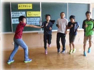
[健康委員会による朝マラソンの説明]

マラソン大会に向けて、授業や朝マラソンだけでなく、昼休みにも自主的に走っている姿が見られます。